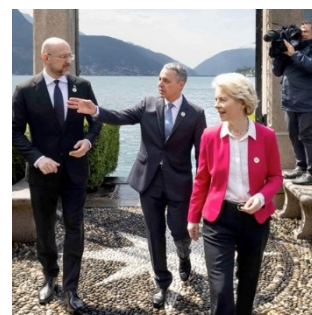
Ignazio Cassis sur les rives du lac de Lugano avec le premier ministre ukrainien et la présidente de la Commission européenne.