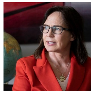
Paelvi Pulli, cheffe de la Politique de sécurité du DDPS, parle de la relation de la Suisse avec l'OTAN, dans un article souvent cité de l'agence Reuters.