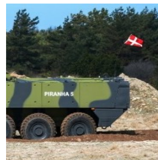
Des véhicules militaires produits en Suisse comme le Mowag Piranha 5 ne sont pas livrés à l'Ukraine.

socials étrangers, en particulier, le ton est souvent critique et polémique. L'intention de la Finlande et de la Suède d'adhérer à l'OTAN place en outre la focale sur le positionnement de la Suisse en matière de politique de sécurité. Avec des références fréquentes au débat politique interne en Suisse, des discussions sont consacrées dans les médias étrangers à la nécessité pour la Suisse d'adapter sa conception de la neutralité au nouvel ordre mondial de paix et de sécurité. Les tribunes du président de la Confédération Ignazio Cassis publiées dans divers médias étrangers occidentaux donnent une visibilité internationale à la position de la Suisse sur sa neutralité et sa mise en œuvre. Les médias russes reprochent pour leur part à la Suisse d'avoir perdu sa crédibilité d'État neutre en reprenant intégralement les sanctions internationales. L'élection de la Suisse au Conseil de sécurité de l'ONU en juin dernier donne lieu aussi à la parution d'articles plus nuancés, par exemple sur la distinction entre droit de la neutralité et politique de neutralité.