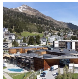
Le WEF tenu en mai est souvent illustré par des photos de Davos sans couverture neigeuse.

De nombreux médias étrangers parlent du WEF de retour à Davos après deux ans d'absence. Le volume des informations qui lui sont consacrées est cependant légèrement plus faible que lors des éditions précédentes. L'accent est mis sur le discours du président ukrainien Zelenskyj et la non-participation de la Russie. La Suisse est de